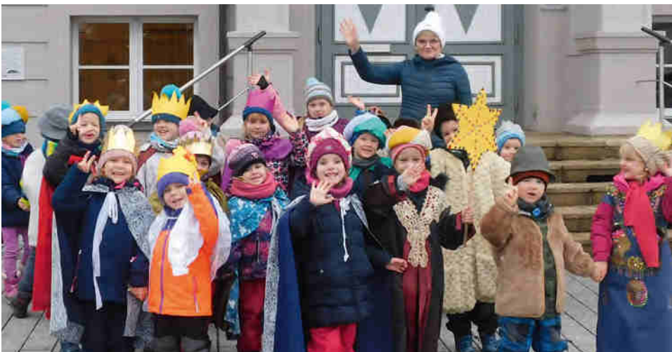
Sternsinger des Christlichen Kindergartens „Sonnenschein“ vor dem Rathaus im Januar 2020